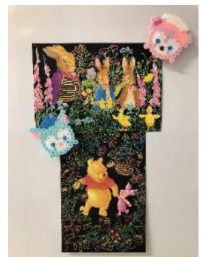
～創作活動の作品集～