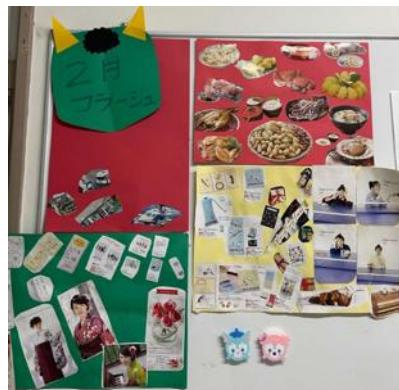
～創作活動の作品集～