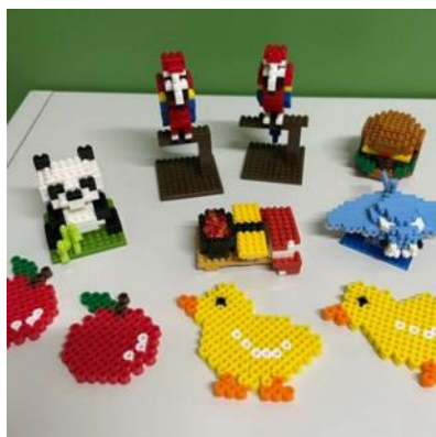
～創作活動の作品集～